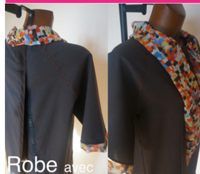
Robe avec fermetures magnétiques

Pour cela, cette équipe développe une nouvelle solution vestimentaire en se basant sur les pratiques observées des soignants. Des découpes fonctionnelles originales, un système de fermetures magnétiques ayant fait l'objet d'un brevet et des textiles performants permettent de limiter la pénibilité du travail. Ces techniques améliorent la gestuelle des soignants et procurent un gain de temps lors de l'habillement. Cela apporte aussi un meilleur confort aux personnes âgées. C'est un moyen de satisfaire le besoin d'estime de soi, mais également de faciliter la relation soignants/personnes dépendantes.